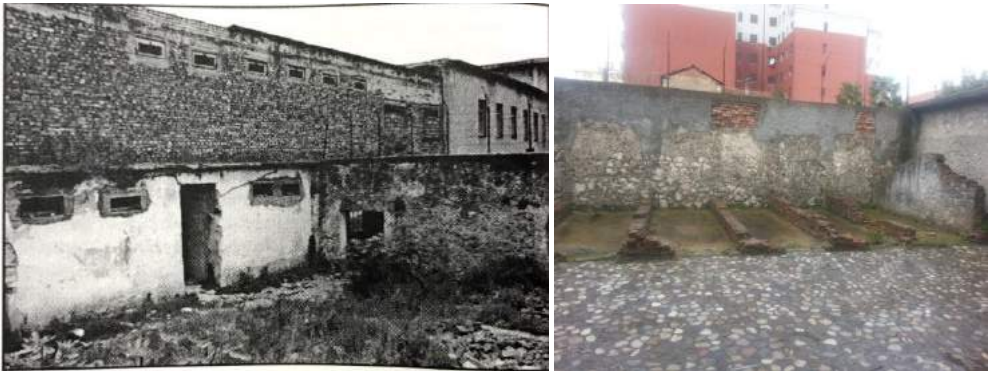
Oborri i ajrimit në periudhën e komunizmit dhe oborri i ajrimit sot si pjesë e muzeut.

Gjithashtu, janë shumë me interes qelitë e ruajtura të paprekura, së bashku me shënimet e bëra nga vetë të burgosurit. Mund të shohësh fare qartë simbolet e "gdhendura" nëpër muret e burgut, të tilla si: xhami me minare, kryq, yll e hënë, numra që ngjasojnë me mbajtjen e një kalendari etj. Për këto simbole, përgjegjësi i muzeut tregon se do duhet t'i nënshtrohen një "ekspertize" për të çkoduar shenjat e vijave, vizatimeve, fjalëve apo lutjeve, pasi shkrimet e vona mund të fshehin nën to semiotikën e përdorur në atë kohë e ato kushte nga të burgosurit politikë. Meqë ky ka qenë edhe burg, ku "kanë vuajtur" dhe spiunë 23 dhe, deri vonë, ka shërbyer si burg për civilët, do duhej si fillim të spastrohej shtresa historike e burgut komunist, që ka humbur prej gjurmëve të një burgu tjetër. Duke pasur parasysh luftën e hapur të diktaturës kundër fesë, këto mesazhe në muret e burgut mund t'i kuptojmë në dy dimensione, së pari si mënyrë rezistence dhe lirie brenda mureve të burgut (në mesin e tyre u krijua një hapësirë e sigurt që u siguronte të burgosurve një ndjenjë lirie, pa pasur nevojë për të dhënë shpjegime) dhe, së dyti, si formë provokimi (duke pasur brenda burgut edhe spiunë, simbolet fetare mund të vinin edhe si formë provokimi). Këto qeli