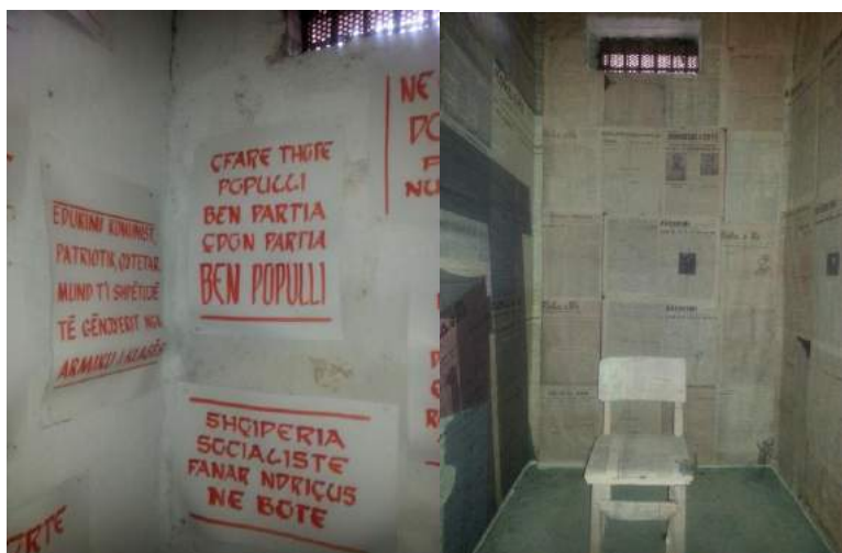
Foto nga dhomat tematike që janë pjesë e muzeut

të punuara nga të burgosurit: objekte të përditshme jetësore (kuti duhani, lugë druri, enë të punuara brenda në burg), libra të ndaluar, uniforma ushtarake etj. Gjithashtu, nëpër stenda ka shumë informacion dhe dokumente origjinale të kohës, që fillon me periudhën e krijimit të partisë komuniste, kryengritjet e para antikomuniste në Shqipëri, jeta nën regjimin komunist, për gjyqet të ndryshëm, dëshmi penaliteti, që tregojnë se si janë zhvilluar gjyqet, letra burgu dhe korrespondenca, objekte të tjera, shkrime origjinale të asaj kohe dhe gjithë ky rrëfim përfundon me rrëzimin e komunizmit në vitin 1991. Pra, kjo dhomë është mjaft e rëndësishme për të marrë një informacion të jetës në periudhën e komunizmit.