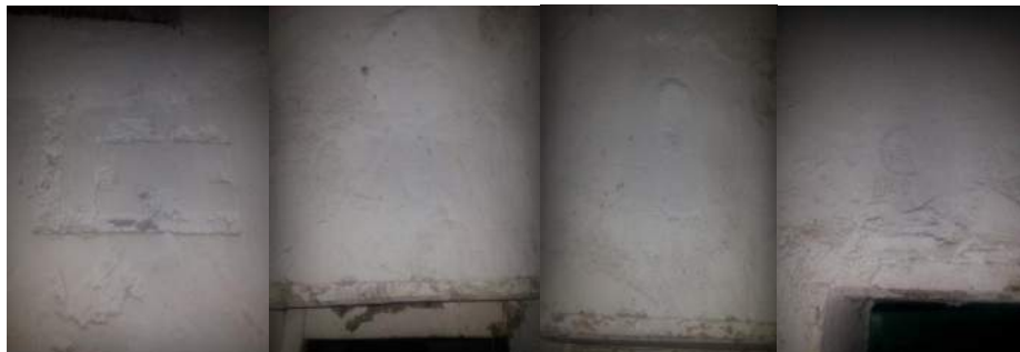
Shënime të bëra nga të burgosurit, sot pjesë e muzeut

sjellin dhe kulmin e përvojës ekspozuese, pasi vizitori inkurajohet më pas të hyjë në qelitë e torturës dhe të paraburgimit.