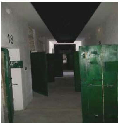
Korridori original i burgut gjatë viteve të komunizmit dhe korridori i muzeut sot 22

Mënyra e paraqitjes së ekspozitës është tipike e këtyre llojeve të muzeve, ku teknikat janë shumë eksperimentale duke krijuar hapësira të mbyllura, të ngushta e pa dritë për të ndihmuar në rigjenerimin e përvojës së viktimave. Gjatë gjithë kohës, ciceroni i muzeut i rrëfen vizitorit histori individuale të terrorit dhe vuajtjes si dhe ekzekutimet e qindra personave. Kjo e bën vizitorin të ecë në hapat e atyre që u futën në këtë ish-burg dhe nuk dolën më.