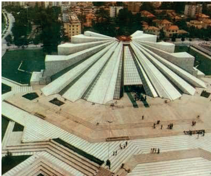
Fig. 1. Piramida në vitet 1988-1990 14