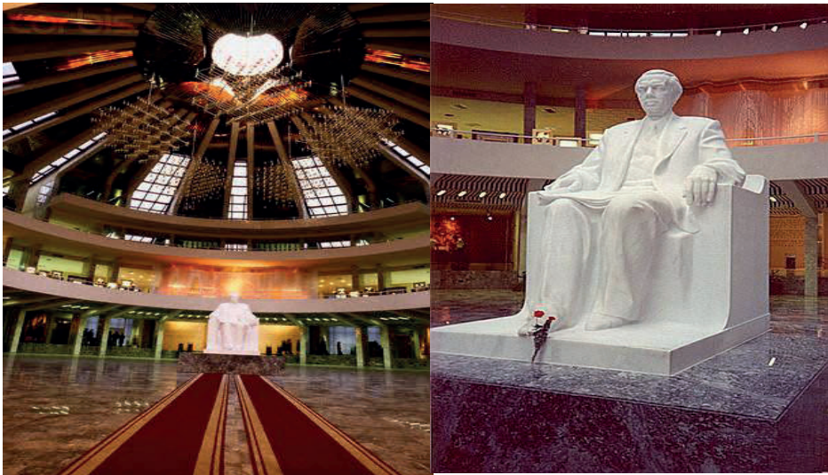
Fig.2 Monumenti në mermer të bardhë i vendosur në qëndër të muzeut 17

Pas përfundimit të shpejtë të tij, ky muze u hap për vizitorët më 1988. Aty pasqyrohej jeta, lufta dhe puna e diktatorit, duke u kthyer në një simbol të veçantë, të papërdorur ndonjëherë, por, në të njëjtën kohë, sa më të komunikueshëm për mjedisin përreth, me peizazhin e veçanërisht me njerëzit. Ai u bë qendra simbolike e sheshit të kryeqytetit duke reflektuar rëndësinë e diktatorit në histori, pra, ai nuk ishte më thjesht një muze ku shfaqeshin objektet personale të diktatorit, por ishte një monument i epokës së tij, duke e bërë atë një vend të kujtesës kolektive.