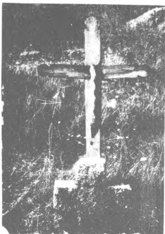
Fig. 1. Croix en bois avec serpent dans le cimetière catholique du village de Tuz.