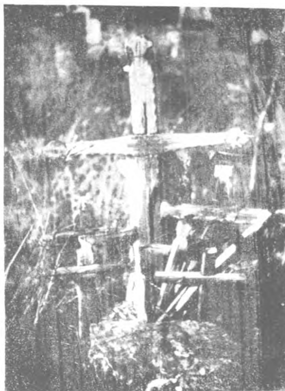
Fig. 2. Croix en bois serpent dans le cimetière catholique du village de Vukan Lekaj (Vuksan Lekići)