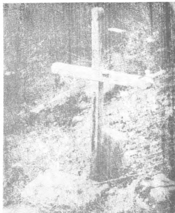
Fig. 4. Croix en bois avec serpent dans le cimetière catholique de Traboina