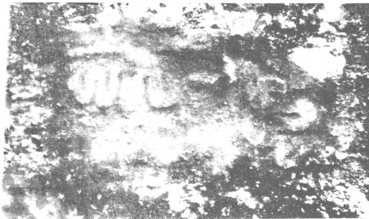
Fig. 5. Monument funéraire en pierre avec représentation de deux serpents dans le village de Ljara