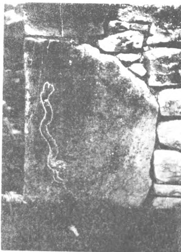
Fig. 6. Représentation de serpent sur le chambranle d'une maison du village de Tuz