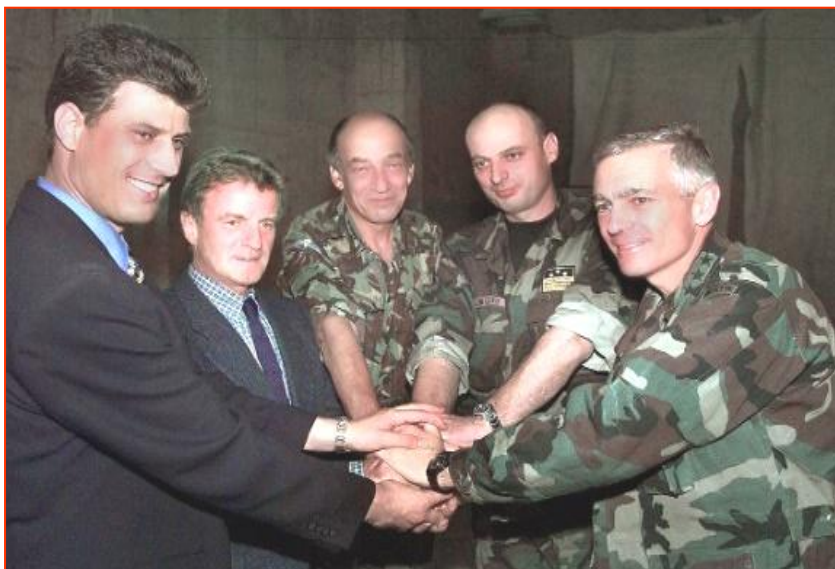
Figura 1. Udhëheqësi i UÇK-së, Hashim Thaçi, Bernard Kouchner i OKB-së, gjenerallejtënant britanik Mike Jackson, shefi i Shtabit të UÇK-së Agim Çeku dhe gjenerali amerikan Wesley Clark, bashkohen në ceremoninë e nënshkrimit. 32

Krizave, me titull “Çfarë ka ndodhur me UÇK-në?”, publikuar më 3 mars 2000. 29 Duke qenë se me Rezolutën 1244, miratuar nga Këshilli i Sigurimit i OKB-së në mbledhjen 4011, më 10 qershor 1999, ku në Pikën 9b parashihet Demilitarizimi i Ushtrisë Çlirimtare të Kosovës (UÇK) 30 ; duke qenë se demilitarizimi i UÇK-së ishte edhe pjesë e Marrëveshjes së Rambujesë, atëherë përfaqësuesi special i Sekretarit të Përgjithshëm (PSSP), Bernar Kushner, në përputhje me autorizimin që i ishte dhënë me Rezolutën 1244, më 20 shtator 1999, e kishte shpallur publikisht Themelimin e Trupave Mbrojtëse të Kosovës 31 .