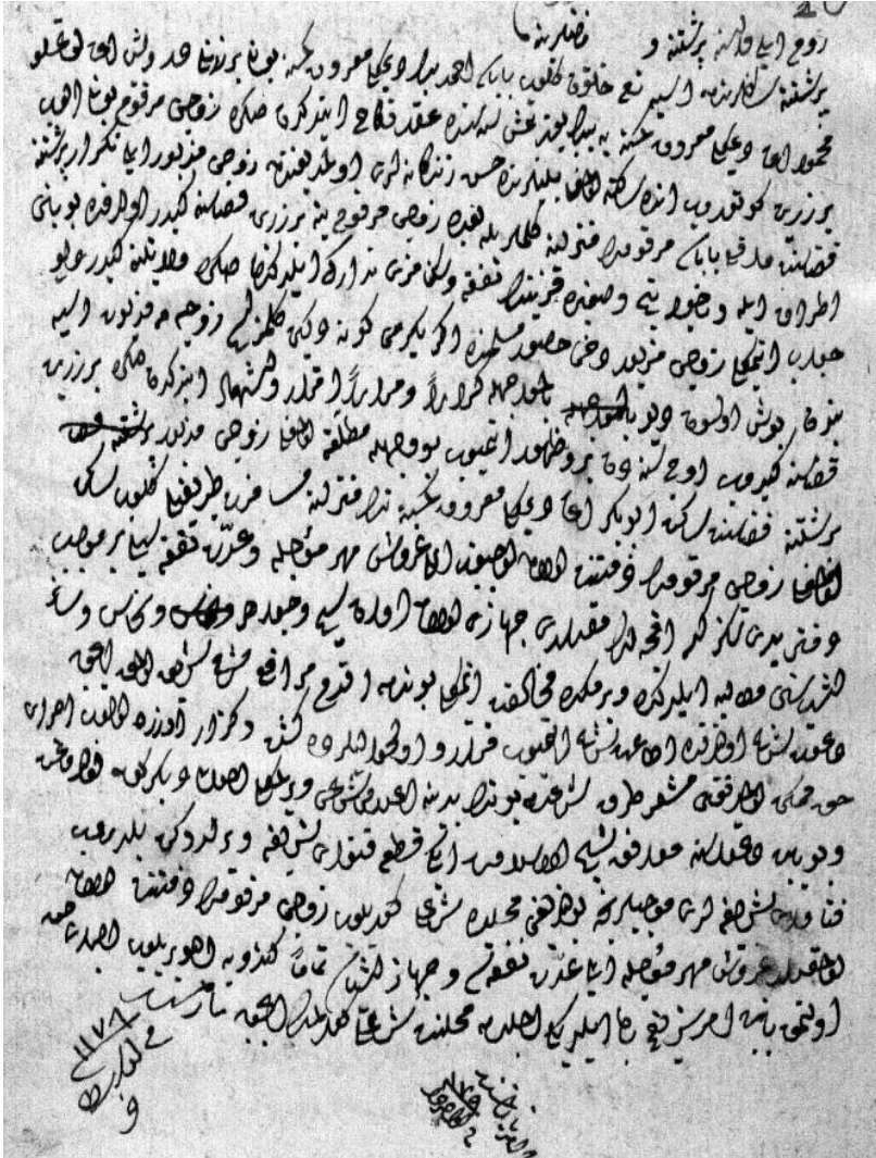
1. Vendimi ndaj ankesës së znj. Asije, në raport me të drejtën e vajzës së saj Bunit për kompensimin e të drejtës së dhuratës martesore dhe dhuratës së ndarjes.