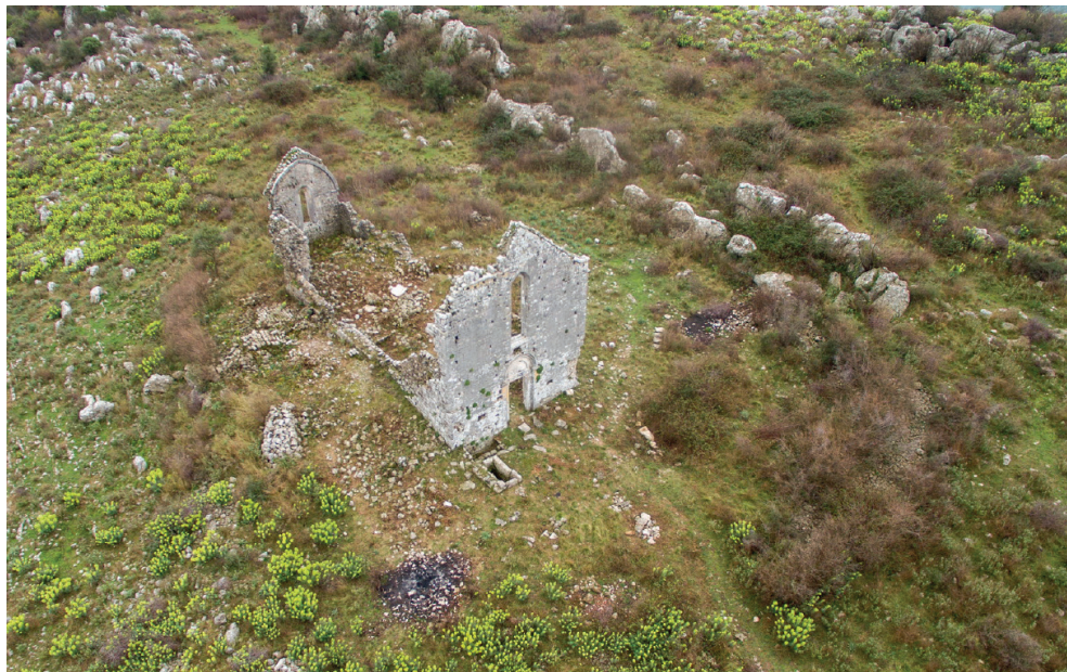
Mbetjet e kishës së Shën Mërisë.