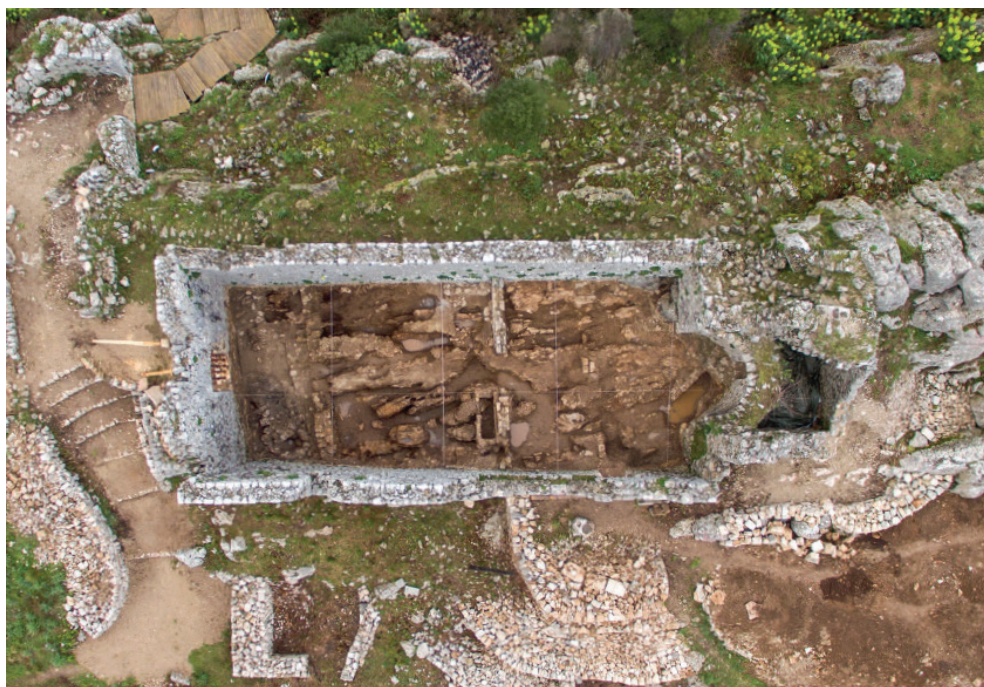
Shasi, Mbetjet e Katedrales së Shën Gjonit.