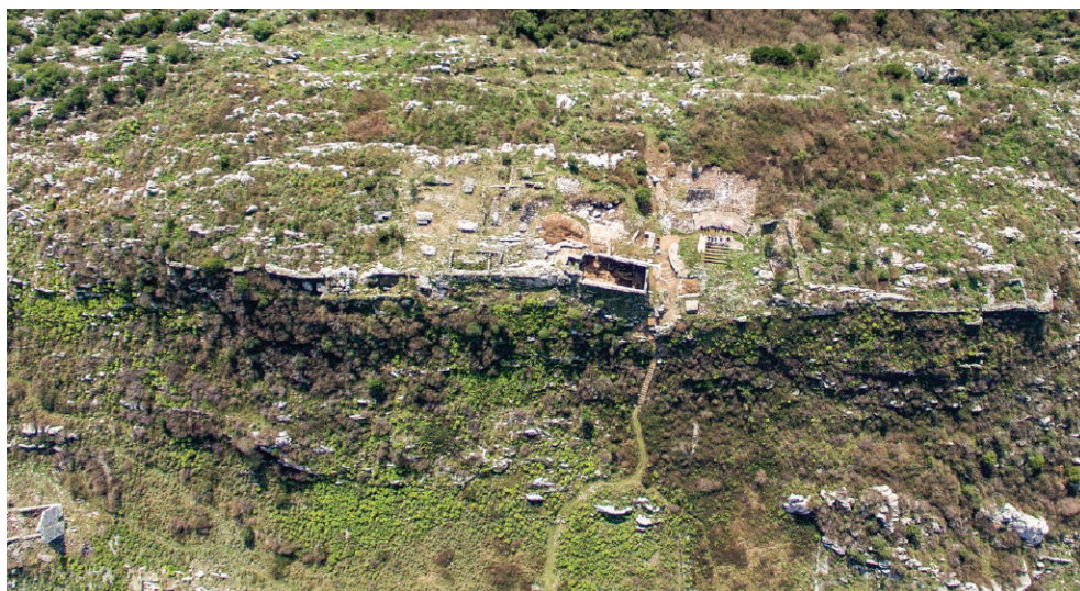
Shasi, qyteti i sipërm me mure.