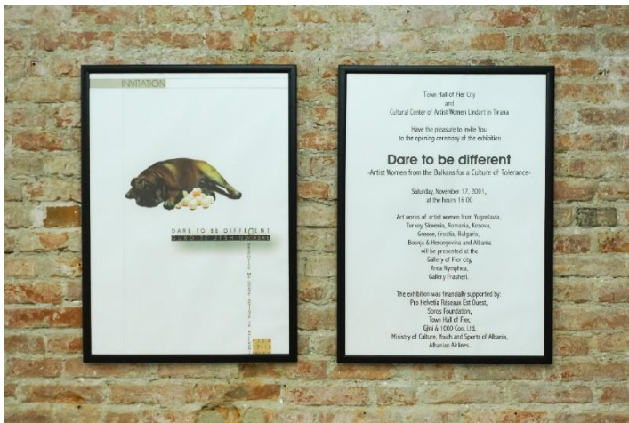
Fig. 4. Afishe e ekspozitës Dare to Be Different (Guxo të jesh ndryshe) në Bibliotekën dhe Laboratorin e Bulevard Art and Media Institute, si pjesë e ekspozitës Diaries: Lindart & the Albanian Women Artists Association , 2022.