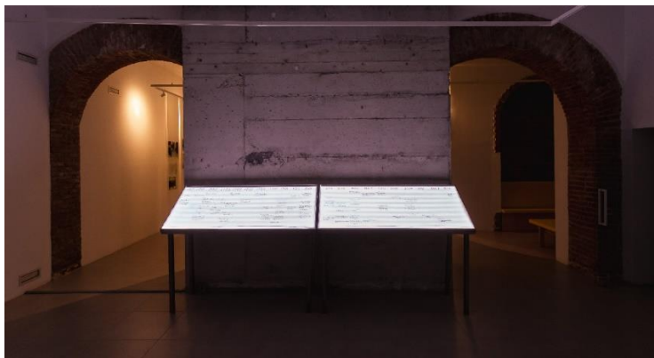
Fig. 5. Dokumentim i instalimit të Diaries: Lindart & the Albanian Women Artists Association , 2022. Në fotografi: Kalendarët.