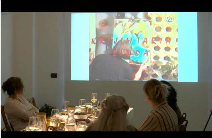
Fig. 2. Kuadër i shkëputur nga video-dokumentimi i takimit të parë të artisteve të “LindArt” më 17 maj 2022. Artistet janë duke parë dokumentarin e vitit 1994 të RTSh-së mbi veprimtarinë e Shoqatës “Linda”.