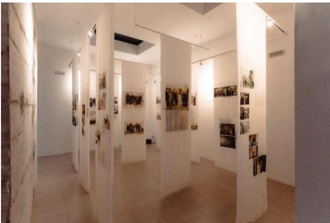
Fig. 3. Fotoalbumi, Diaries: Lindart & the Albanian Women Artists Association (Ditarët: LindArt & Shoqata e Grave Artiste Shqiptare) , 2022.