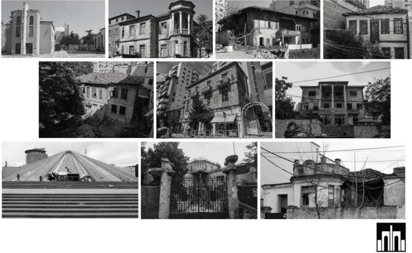
Fig. 1. Përmbledhje e disa prej ndërtesave të hartëzuara në platformë.