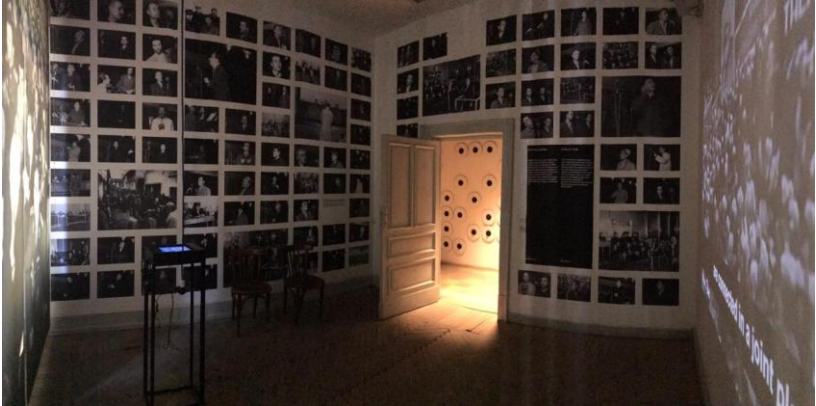
Fig. 7. Pamje e ekspozitës në Shtëpinë e Gjethëve .