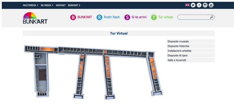
Fig. 1. Skicë e planimetrisë së Bunk'Art I . Seksionet e shënuara me të verdhë përfaqësojnë ekspozitën muzeale. Burimi: www.bunkart.al/1/virtual_tour .