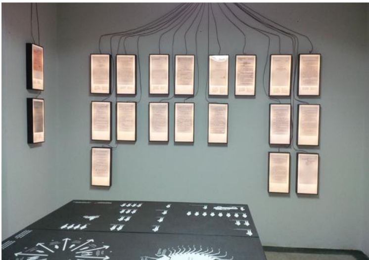
Fig. 4. Pamje e ekspozitës në Shtëpinë e Gjetheve .