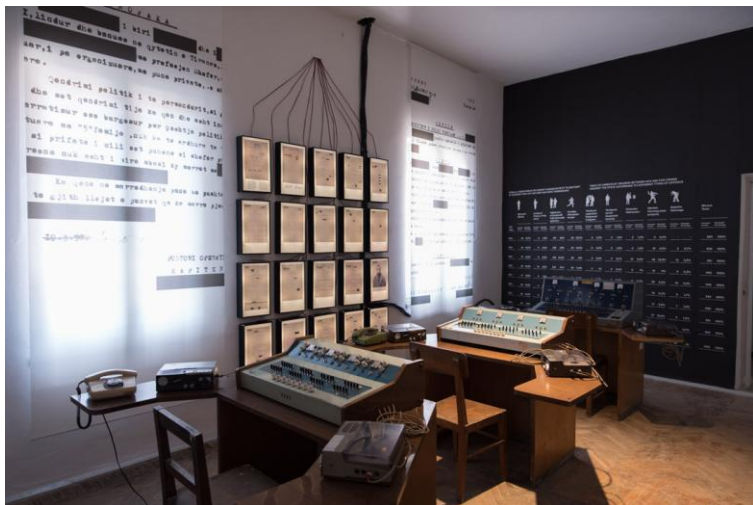
Fig. 5. Pamje e ekspozitës në Shtëpinë e Gjethëve .