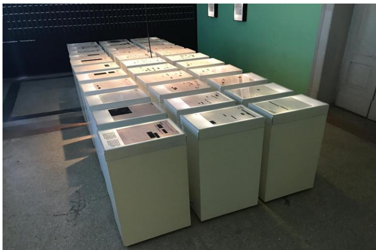
Fig. 6. Pamje e ekspozitës në Shtëpinë e Gjethëve .