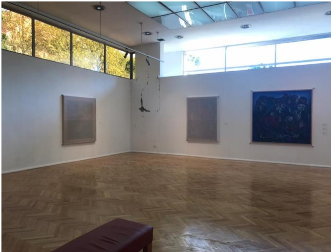
Fig. 1-2. Foto instilacionesh të ekspozitës Tirana Patience që tregon dëmet e shkaktuara nga tërmeti i 26 nëntorit 2019.