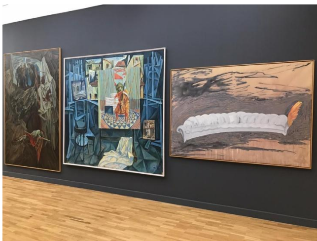
Fig. 6. (M-D) Pikëllimi i netëve kosovare (Edi Rama, 1989), Kompozim (Adrian Paci dhe Edi Muka, 1989) dhe Poltroni (Edi Hila, 1998).