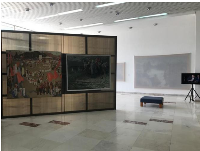
Fig. 5. Ekspozim i pikturave të realizmit socialist, montuar në panele bojëkafe, gjysmë të tejdukshme nga ekspozita Arkivi i Hapur , që zinte vend brenda hapësirës së ekspozitës Tirana Patience .