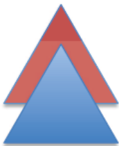
Figura e mëposhtme tregon se si bashkëvepron struktura ekspresive me strukturën leksikore. Trekëndëshi që ndodhet sipër tregon strukturën ekspresive, ndërsa trekëndëshi që ndodhet poshtë tregon strukturën leksikore.

Si funksionojnë këto dy shtresa? Dy veçoritë e gjuhës së njeriut që kohët e fundit kanë tërhequr vëmendjen e gjuhëtarëve, lëvizja dhe përshtatja, kanë të