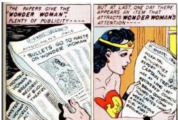
Fig. 6. “Wonder Woman”, Archives v.I, n. 03, (newspaper).

Në fakt, nëse vizatuesi e ka të nevojshme të paraqesë një gazetë, ai mund të vizatojë një fletë të bardhë dhe të bëjë të dallueshëm me sy vetëm titullin, apo të paraqesë titullin dhe tekstin me shenja jo qartësisht të dallueshme/lexueshme. Por ai mund të provojë edhe ta bëjë titullin dhe tekstin të lexueshëm, gjë që nuk mund të mos nxisë arsyetime në një rrafsh të mundshëm analize “specifikisht gjuhësore”/ “kotekstore” 7 . Në të dyja rastet, çështja për t’u theksuar është ajo e shfrytëzimit të tekstit për subjektet me probleme në të lexuar. Në fakt, as në literaturën kushtuar disleksisë, që prek në mënyrë specifike ose përmend temën e rrëfimit të animuar, nuk është specifikuar “teksti i ndërshtënë”, në veçantinë e tij. Këto mangësi, e theksojmë sërish, rrafshojnë karakterin specifik komunikues të tekstit, që paradoksalisht nënkuptohet si tipari më i theksuar metagjuhësor që i atribuohet atij dhe që shpesh shpallet si element themelor kur tentohet të përcaktohen kufijtë e nocionit (Bronckart 2004, p. 115).