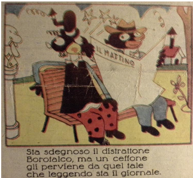
Fig. 5. “Modellina”, viti VIII, N.5 1-8/02/1941, f.1.

Pasi u sqarua që teksti i “rrëfimit të animuar” mund të ketë hapësira paraqitjeje të mëtejshme përveç didaskalive, teksteve brenda “tymit”, kornizimeve të ndryshme pamore, për shembull, brenda trupit të ilustrimeve (vinjetave) veç hapësirave jashtë vinjetës, mund të thuhet se mjete të tilla mund të përdoren në mënyrë tekstualisht funksionale, përveçse pak a shumë të ndërgjegjshme (shih figurat 5 e 6) në këto lloj publikimesh.