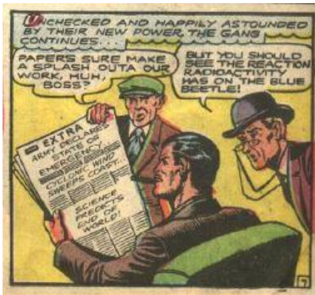
Fig. 1. “BlueBeetle”, vol. 19, 1995 (e përditshme).