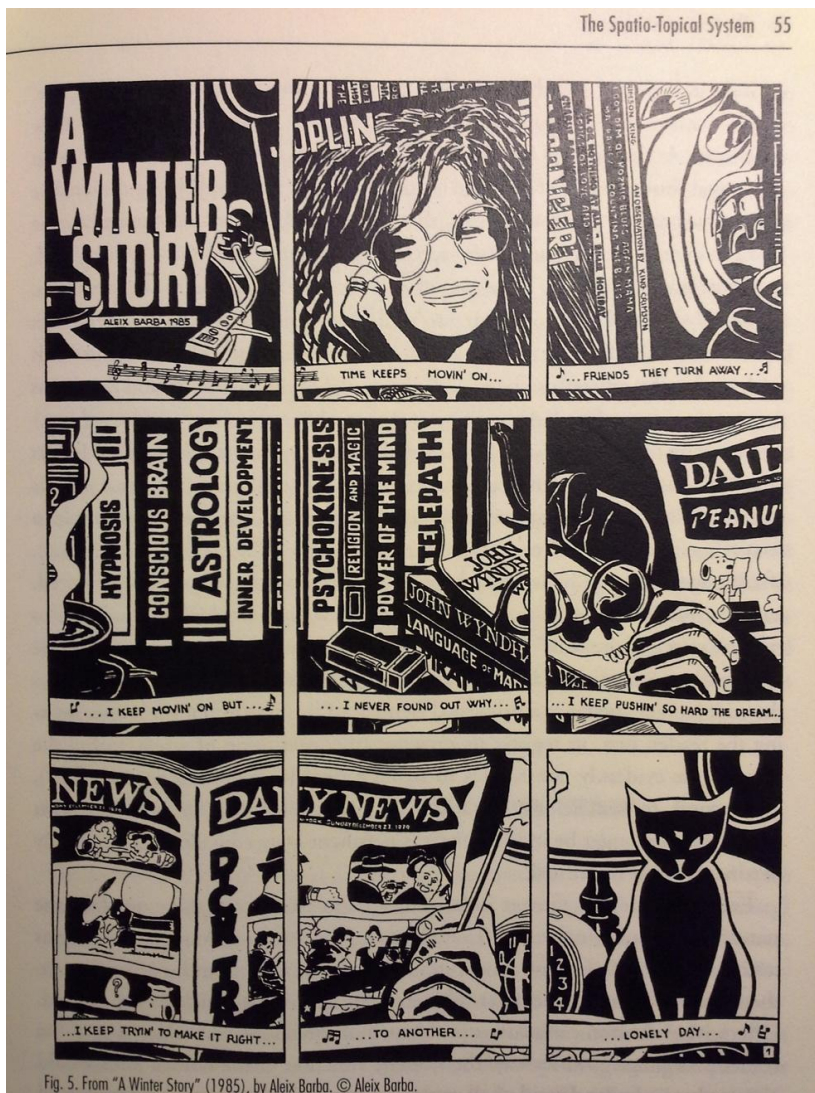
Fig.3. Barba Aleix: a winter story, 1985, "Madriz" n. 29, korrik-gusht 1986.

Pas përcaktimeve më lart, mund të thuhet se dallimi mes paraqitjes së shkruar të një rrëfimi të kryer "jo gojarisht", me atë të kryer "gojarisht" mund të përmblihet si në skemën më poshtë, ku vërehet një prirje e fortë