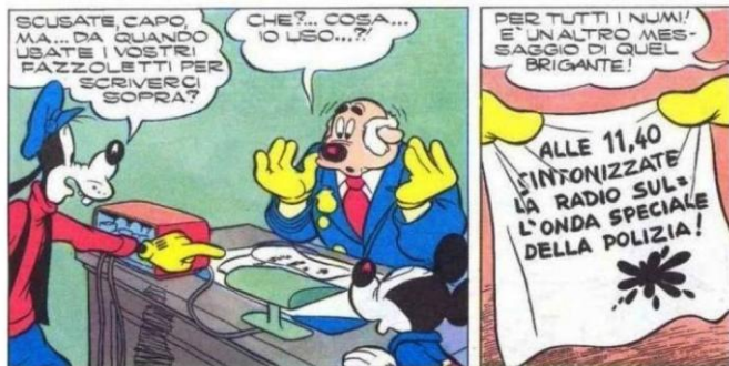
Fig. 2. Topolino dhe sekreti i dyfishtë i Njollës së zezë, f. 24.

Mangësia në përcaktimin e natyrës specifike të “teksteve të ndërshtëna” ka bërë që ato të mos merren në konsideratë as në klasifikimin e tipologjive të teksteve që formojnë “rrefimin e animuar”, “kornizën tekstore në formë reje,