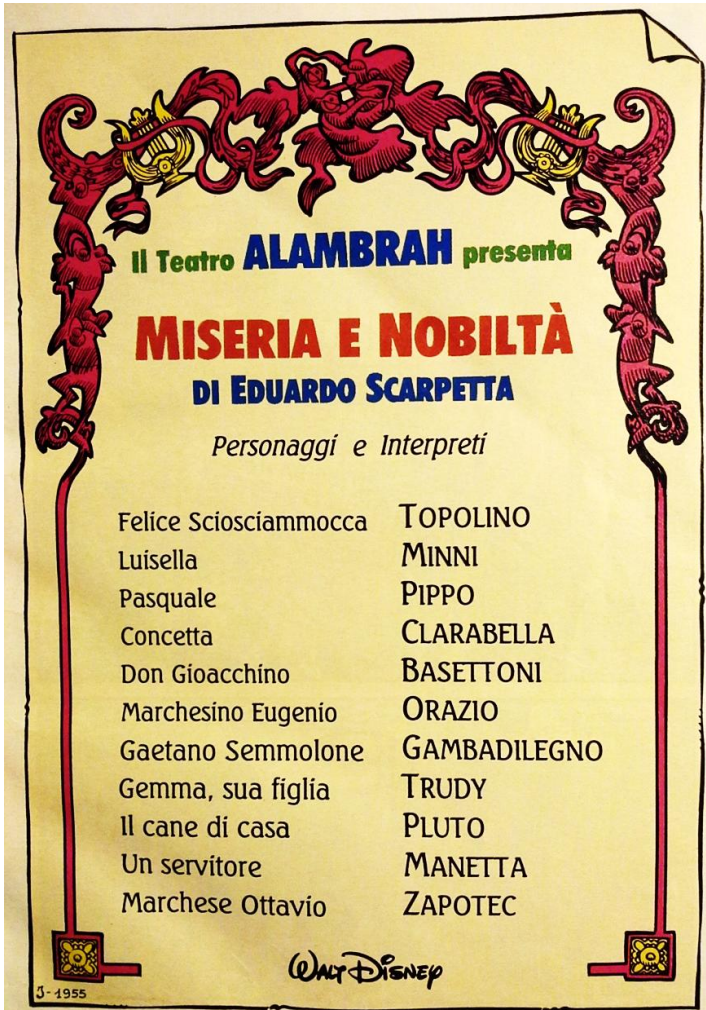
Fig. 8. Topolino, “Miseria e Nobiltà”, n.1955, 16.05.1993, f. 5-1.

Kuptohet, pra, që çështja nuk është aq e thjeshtë për t’u inkuadruar, pasi do të duhej të regjistroheshin dhe klasifikoheshin të gjitha tekstet e ndërshtëna në rrëfimin e animuar (për t’u kufizuar vetëm në një kontekst të mundshëm analize); dhe, siç mund të kuptohet, nëse përpjekja për të realizuar një regjistrim mund të ketë një mundësi realizimi të paktën në rrafsh shembujsh, realizimi i klasifikimit në tipe të teksteve të paraqitura në tekste të tjera, do të ishte më i vështirë, pasi baza teorike e metodologjike mungon ende.