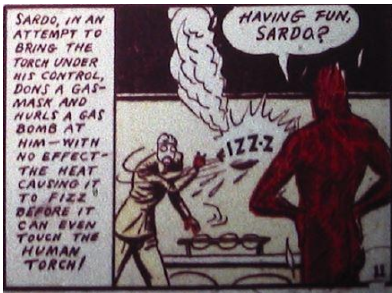
Fig. 4. The human Torch , “Marvel Comics”, vol. 1 1939, n. 1.

Pamorja, pra, riprodhohet iuxta propria principia , - në përputhje me parimin e vet, d.m.th. në mënyrë të figurshme, falë pamjes së kornizuar dhe shfaqjes së anës pamore, ndërsa sonorja riprodhohet duke përdorur të figurshmen, treguesit pamorë nëpërmjet “thjesht” shkrimit të zërit, përveçse gjithë mjeteve të mundshme fonosimbolike që e bëjnë të mundur paraqitjen e tyre. 6